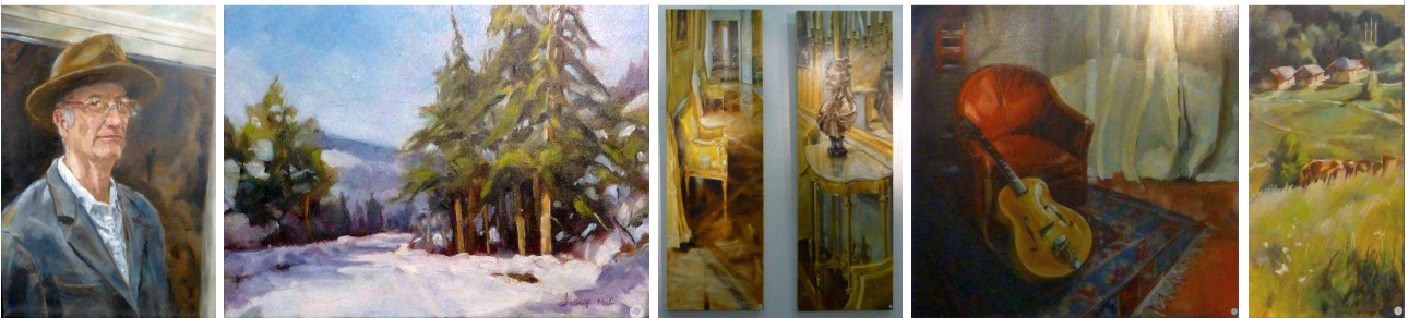
Mick Droux avec ses paysages, ses intérieurs historiques, ses ateliers et ses voitures de légende