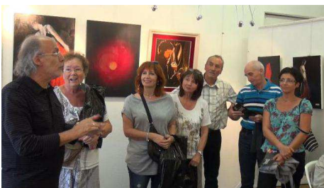
Le président félicite les lauréats

En 2014 le concours d'automne aura lieu le samedi 27 septembre.