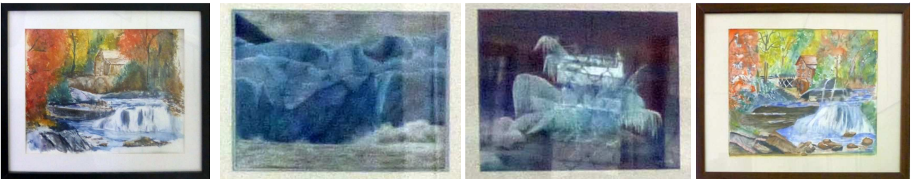
Les Ateliers de la SADAG avec toute la palette de leurs talents