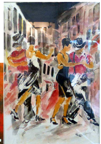
Le premier prix