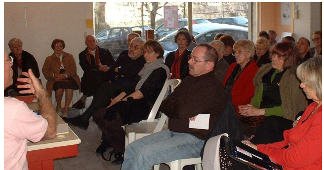
Photos du bureau et d'une partie de l'assemblée