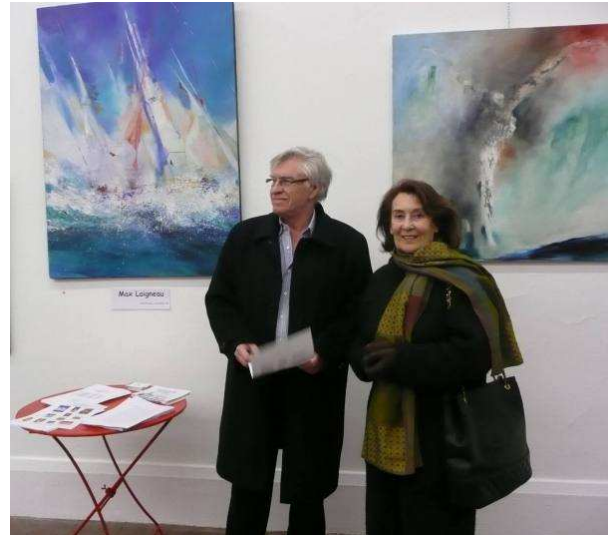
Lauréats et invités d'honneur du salon 2009