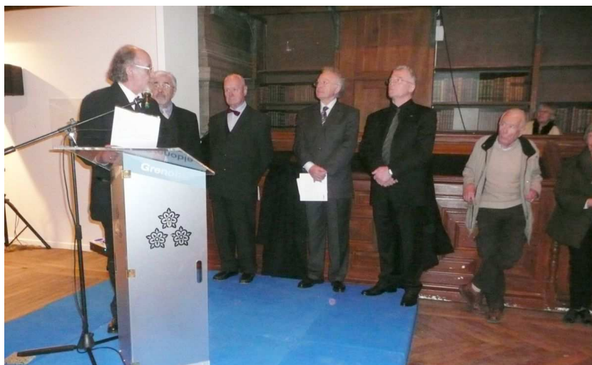
Inauguration avec les représentants officiels