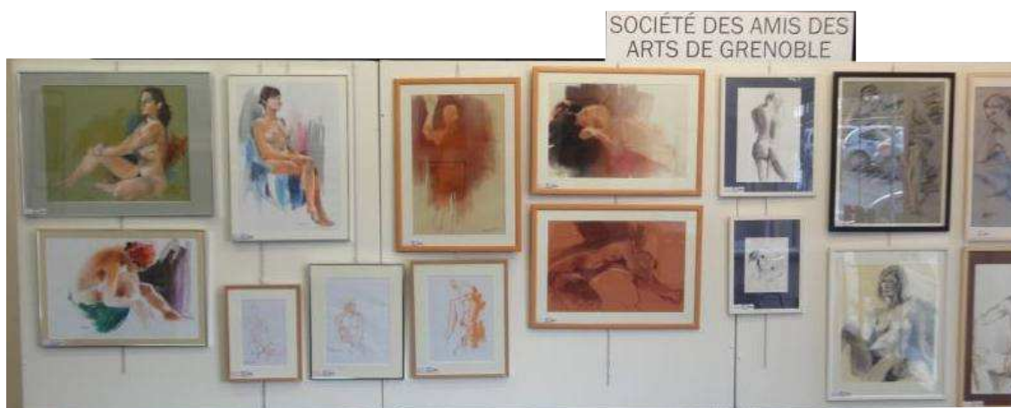
Exposition collective des ateliers grenoblois à l'Espace Boureille sur le thème du nu féminin. Contribution des ateliers de la Sadag