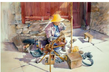
prix aquarelle François Lanvin