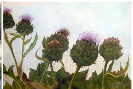
prix des amis du musée Michèle Arnoux