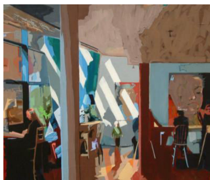
prix de la ville de Grenoble Dana Burns

Un grand merci à notre jury qui à eu la tâche difficile de noter les œuvres et de sélectionner les lauréats.