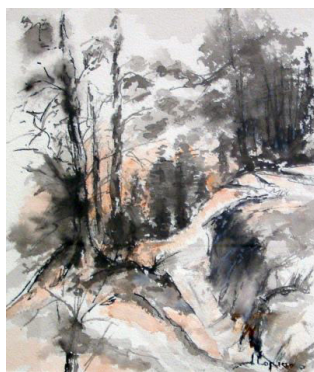
accessit aquarelle Jacques Loprieno