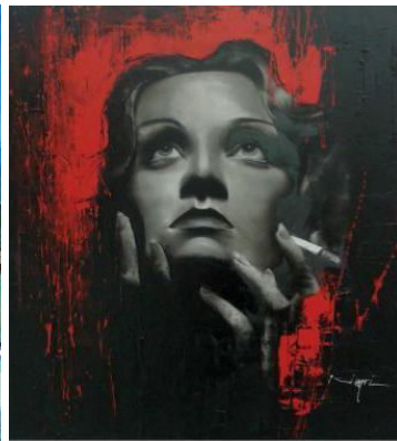
prix de technique mixte Jean-Paul Negri