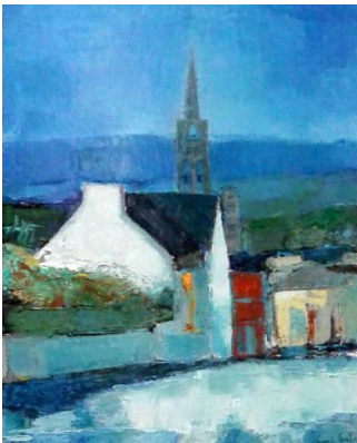
prix huile Francis Gerber