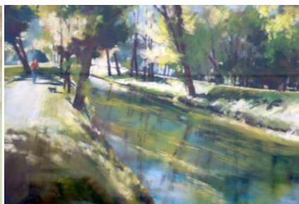
prix pastel Danièle Trigallet