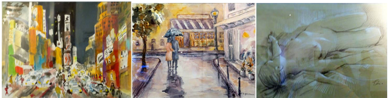
Ateliers de la Sadag